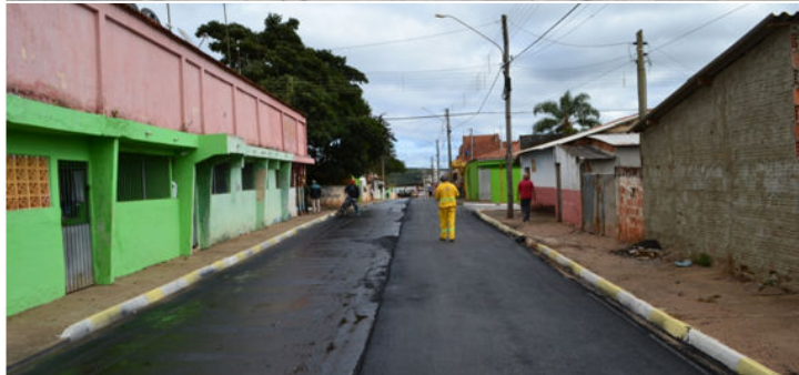
Recapeamento na rua Paulo Mendes de Carvalho na última 5ª feira