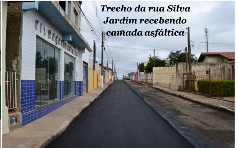
Trecho da rua Silva Jardim recebendo camada asfáltica