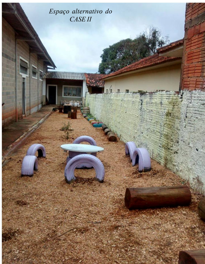
Espaço alternativo do CASE II