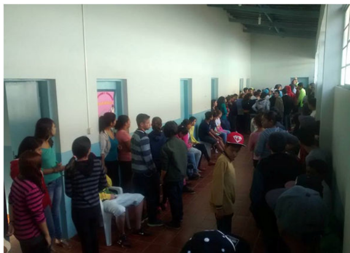
Arrastão da solidariedade realizado em maio

“Quem precisa tem pressa. Estamos na expectativa de um inverno rigoroso e por estamos agilizando a entrega das doações”, destacou a Secretaria de Assistência Social.