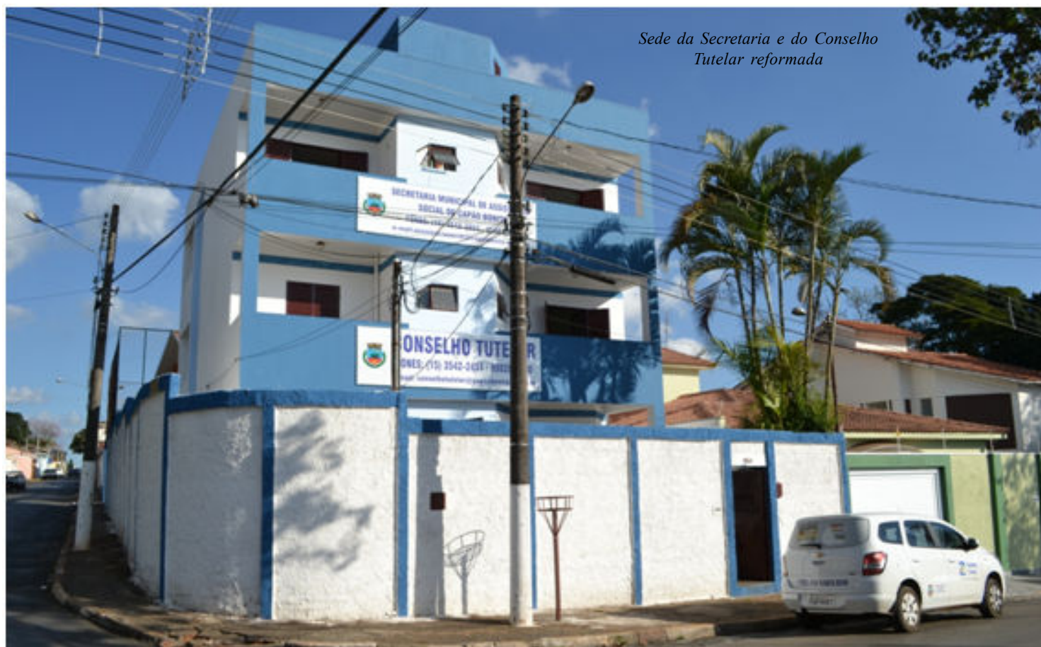
Sede da Secretaria e do Conselho Tutelar reformada