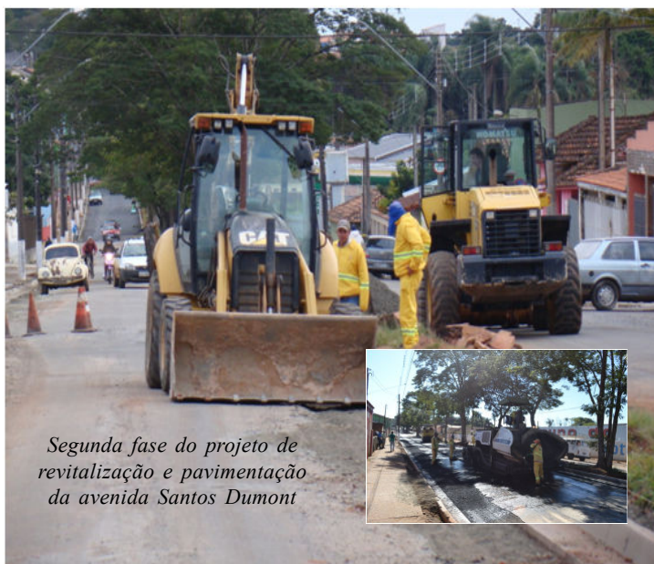
Segunda fase do projeto de revitalização e pavimentação da avenida Santos Dumont

“A avenida Santos Dumont é um dos principais corredores de trânsito do município ao lado da Massaichi Kakihara e Amazonas. A revitalização e um complemento dos projetos já realizados na avenida Elias Jorge Daniel na Vila Aparecida e Brasília Nunes (Vila São Judas/Vila Maria) e com certeza vai contribuir para melhorar o visual urbanístico da nossa cidade”, ressalta a Administração Municipal.