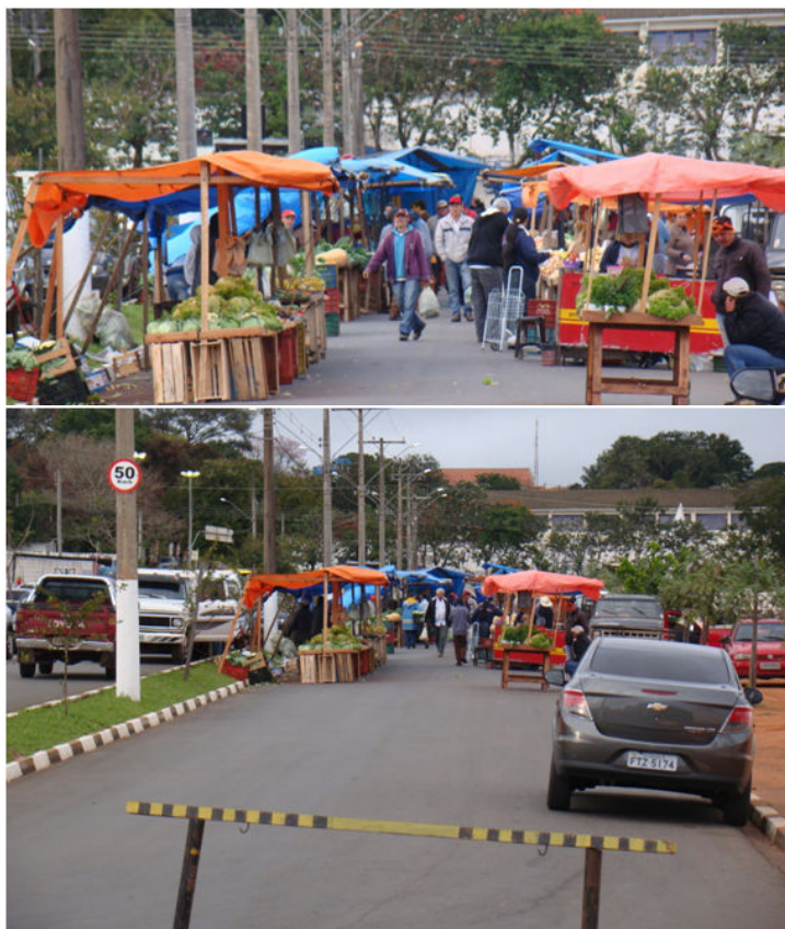
Feira já foi realizada na avenida Amazonas na última quinta-feira

Segundo ainda Secretaria de Agropecuária todas as ações necessárias serão tomadas para que os feirantes fiquem bem instalados na avenida Amazonas, que terá o trânsito parcialmente interditado no trecho do Estádio Municipal durante os períodos de feira.