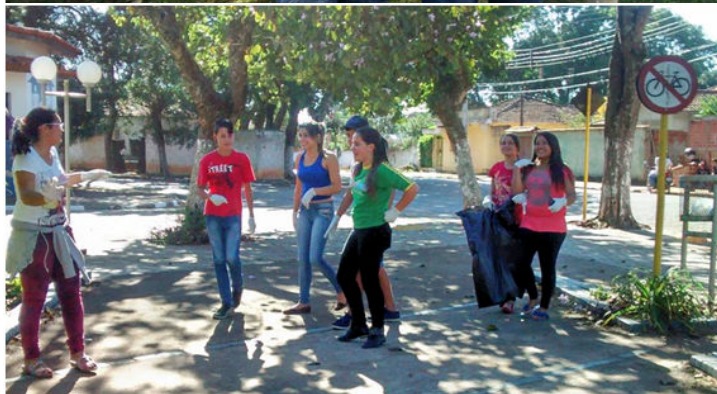
Mutirão de limpeza em diversos espaços públicos da cidade