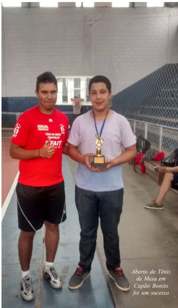
Aberto de Tênis de Mesa em Capão Bonito foi um sucesso