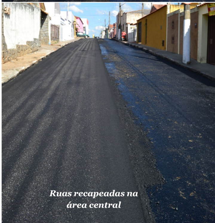
Ruas recapeadas na área central