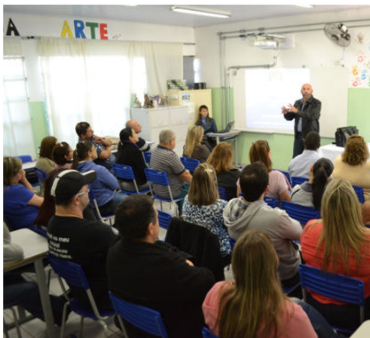
Abertura da Semana de Prevenção às Drogas na escola Padre Arlindo Vieira