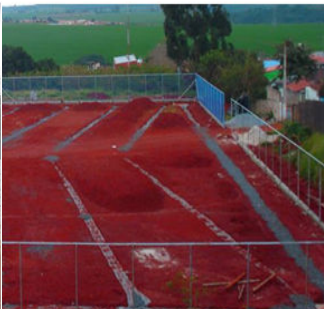
Obras no Complexo do Arcão: campo terá uma das melhores estruturas da região