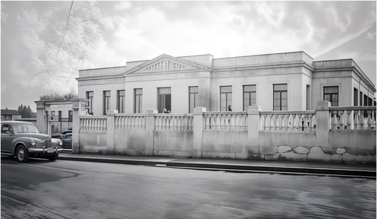
Figura 1: Foto da SCMC em 1923.